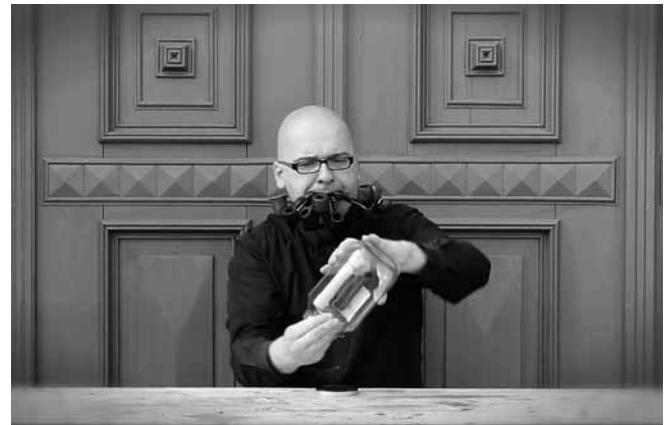
Kamil Kuskowski · Tobacco Road · DVD · 4"20' · 2011