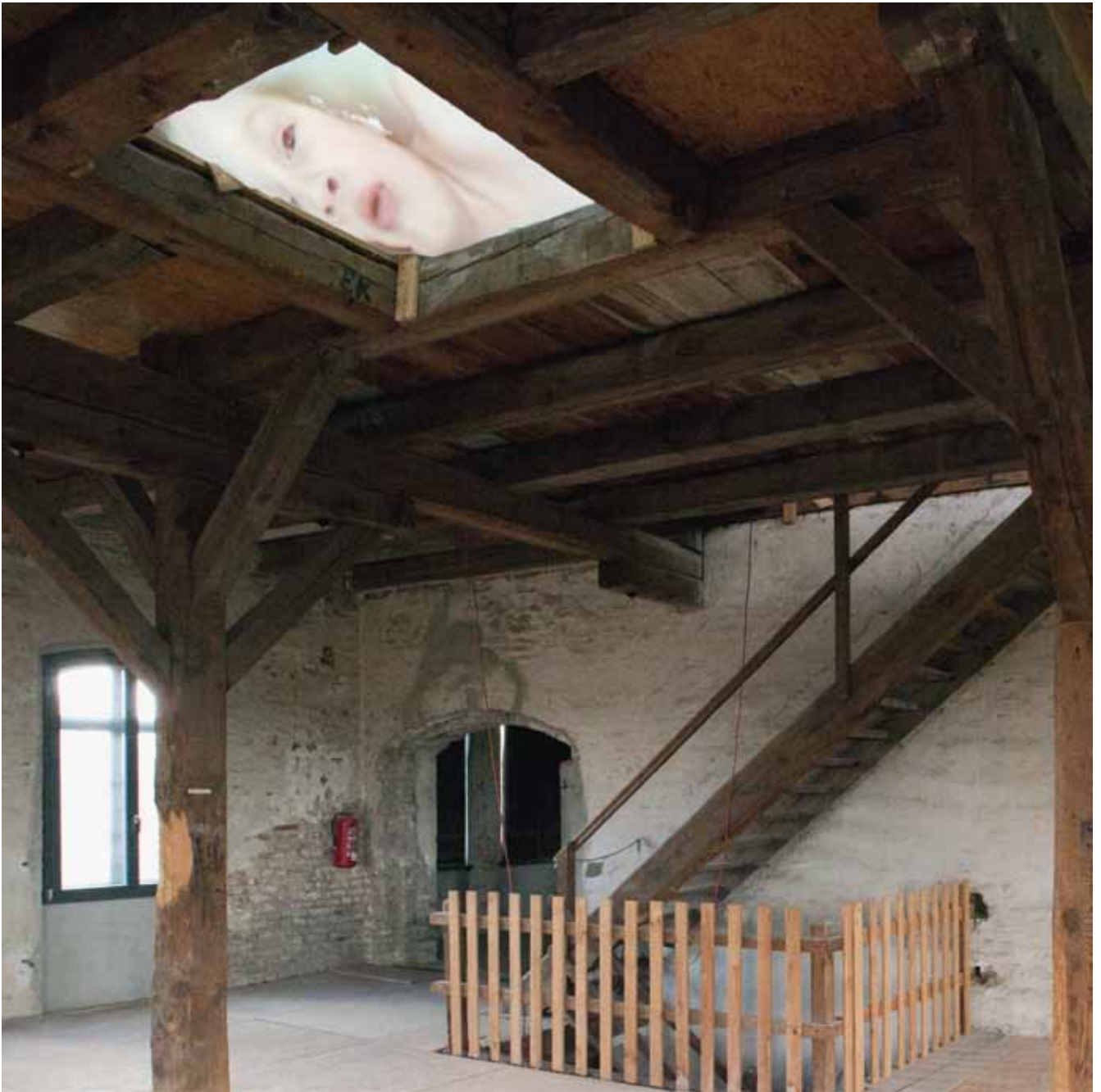
Ute Lindner • zu dumm... • Videoinstallation • DVD • 10"30' • 2011