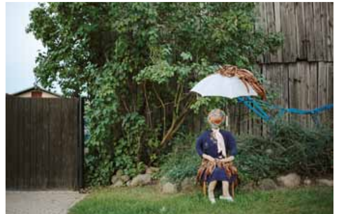
Lukasz Skapski · Tabakblütenfest in Vierraden · DVD · 21 Fotografien · 2011