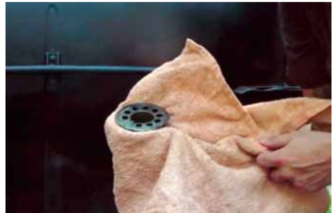
Marcus Sendlinger · Road Movie · DVD · 2011