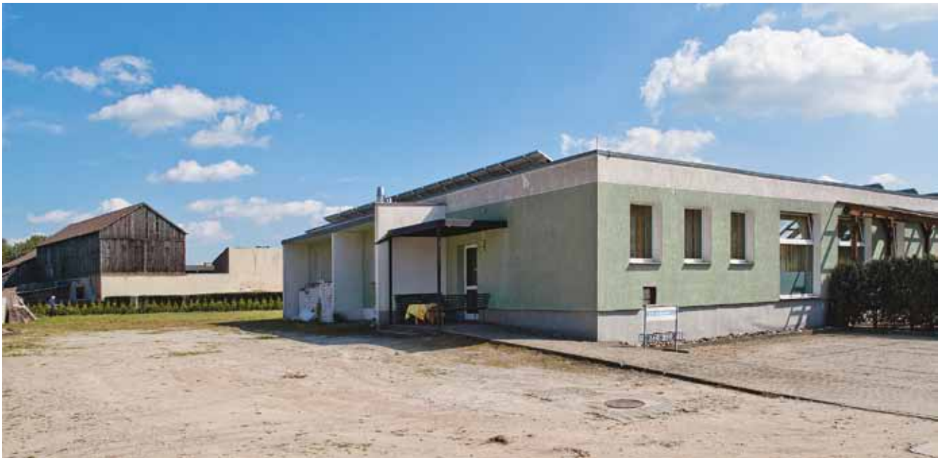
Ralf Michna • ...'cause it's home • Fotografien • Div Größen • 2011