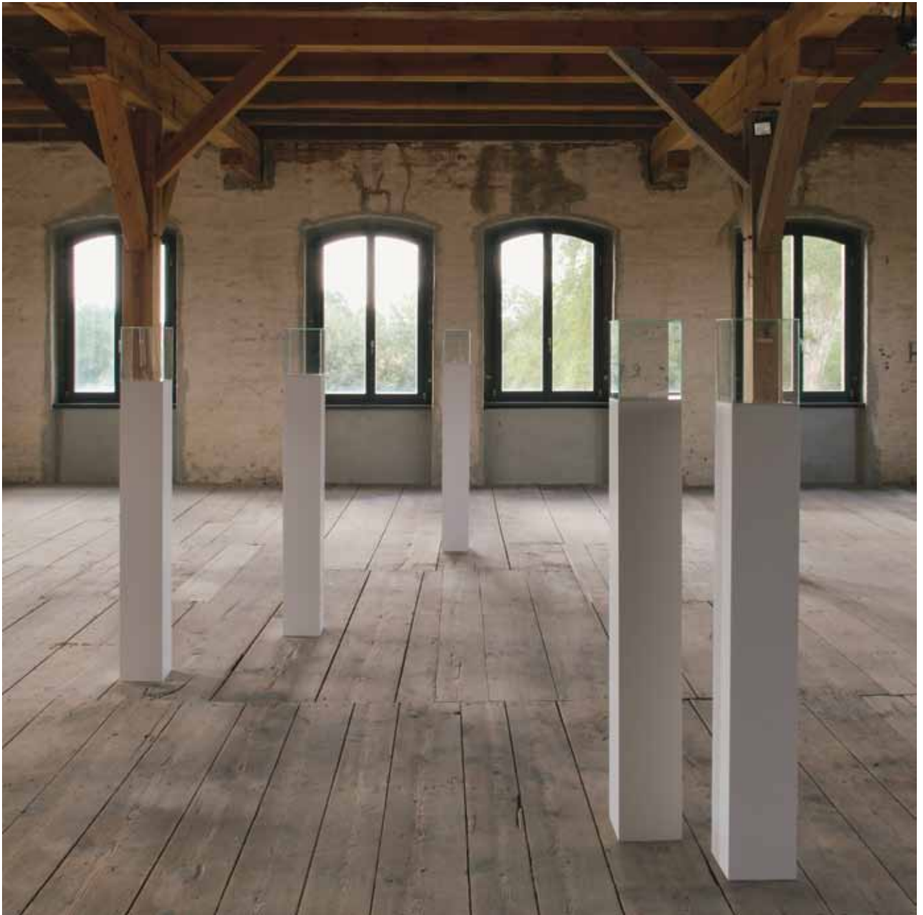
Kathrin Rost • Haarskulptur #01 – #05 • Installationsansicht + Detail